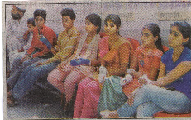
हरिद्वार के मेला अस्पताल में सर्जरी कराने के लिए इंतजार में बैठे लोग • हिन्दुस्तान