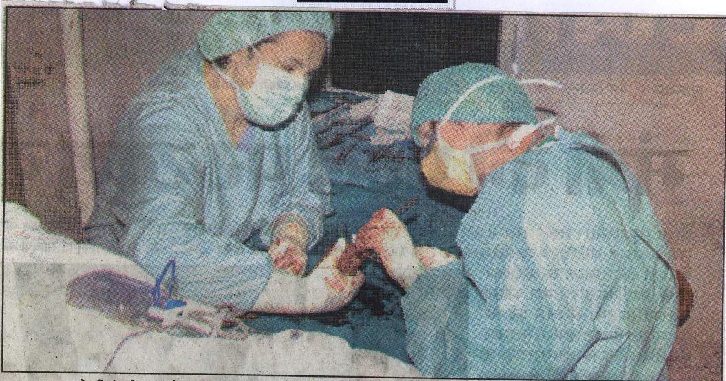
रोटरी इंटरनेशनल के तत्वावधान में लगे निःशुल्क विकलांग सर्जरी शिविर में मरीज का आपरेशन करते जर्मनी से आए डाक्टर।